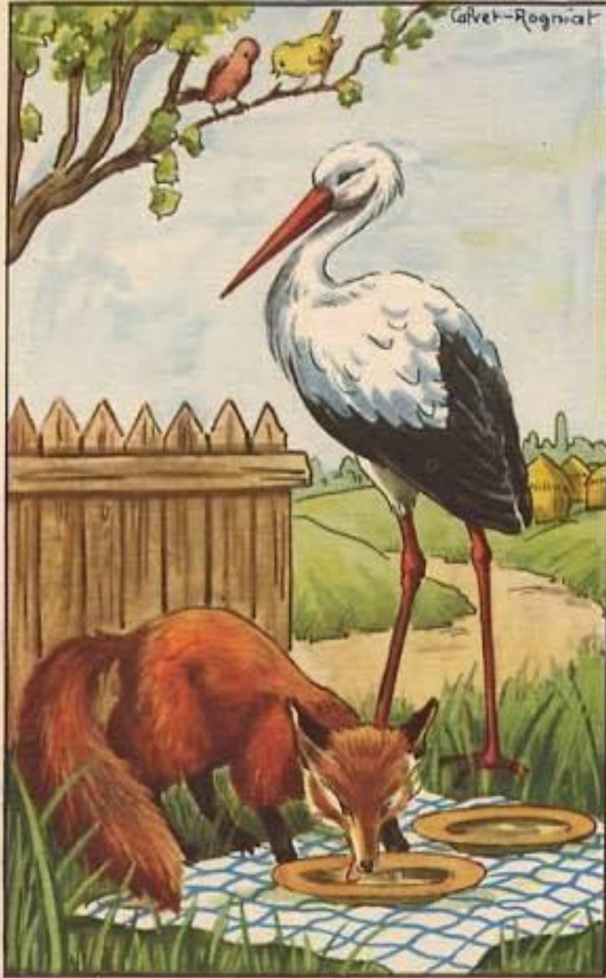
le renard et la cigogne