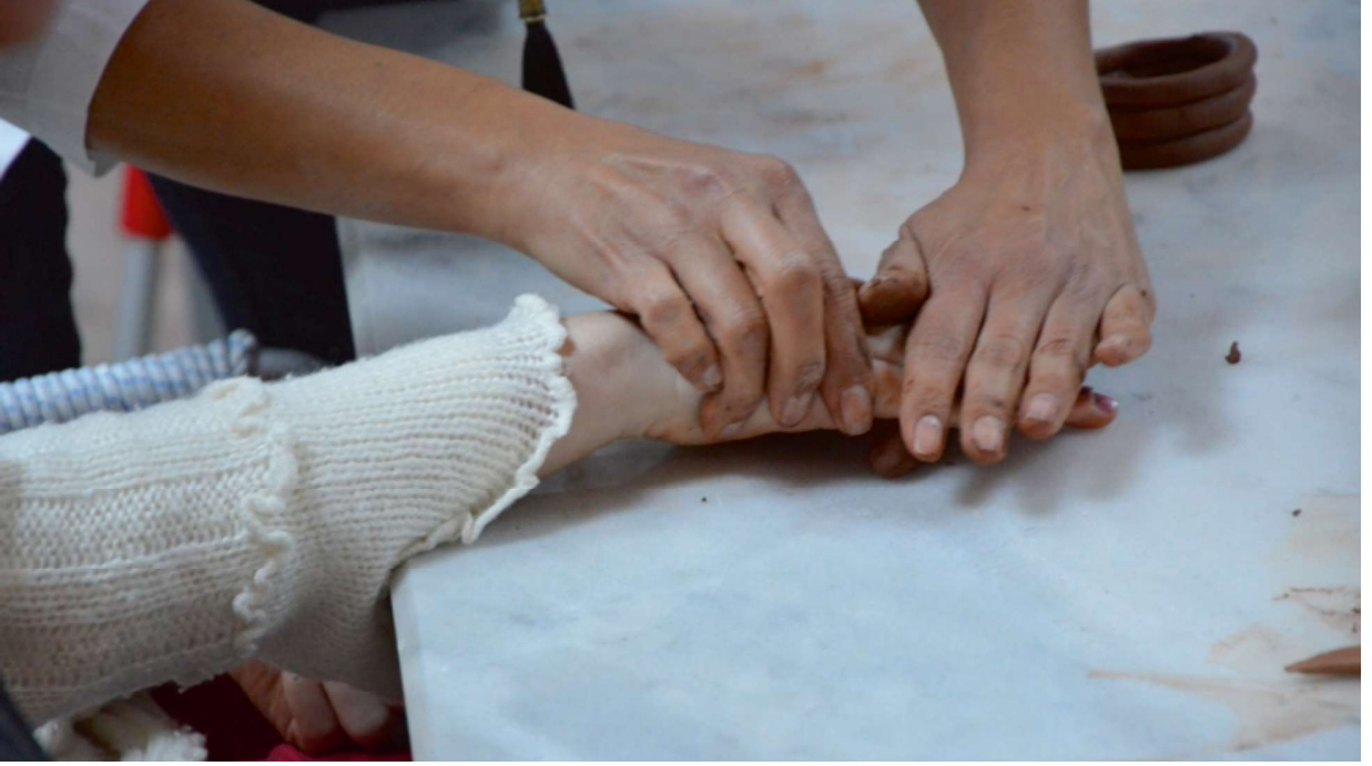
Resim 4. Resim ve Seramik Atölyesi

Ayrıca, engelli ve yaşlıların ulaşımını kolaylaştırmak amacıyla, üniversite tarafından Engelsiz Kültür Sanat Merkezi'ne araç tahsisi yapılmıştır. Bu aracın donanım nitelikleri, AB standartlarına uygun olarak tasarlanmıştır.