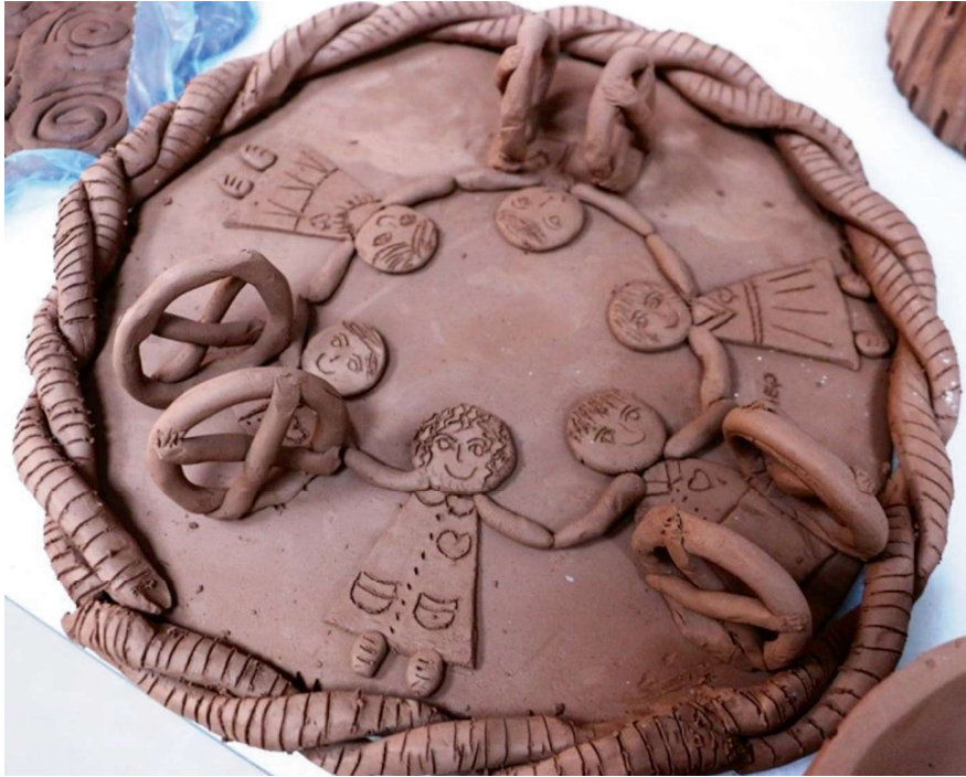
Resim 5. Engelli öğrenciler tarafından yapılan bir aktivite örneği