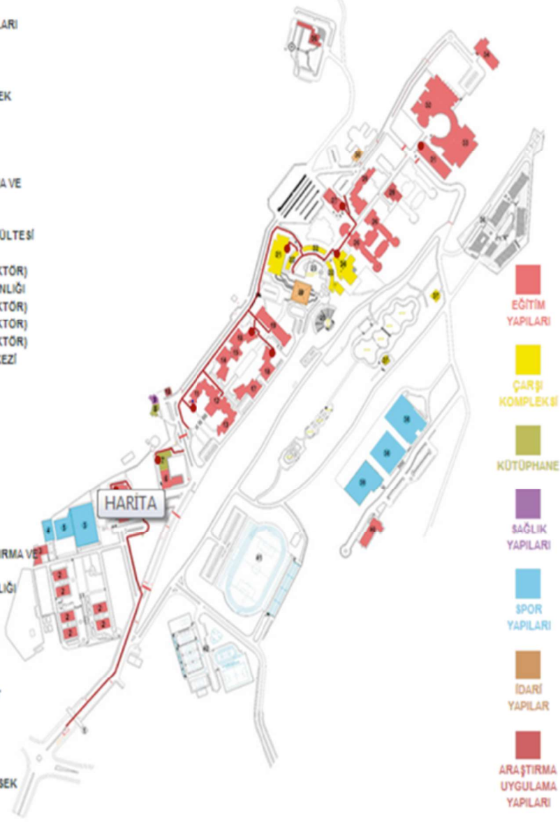
Resim 1. Erişilebilirlik Haritası