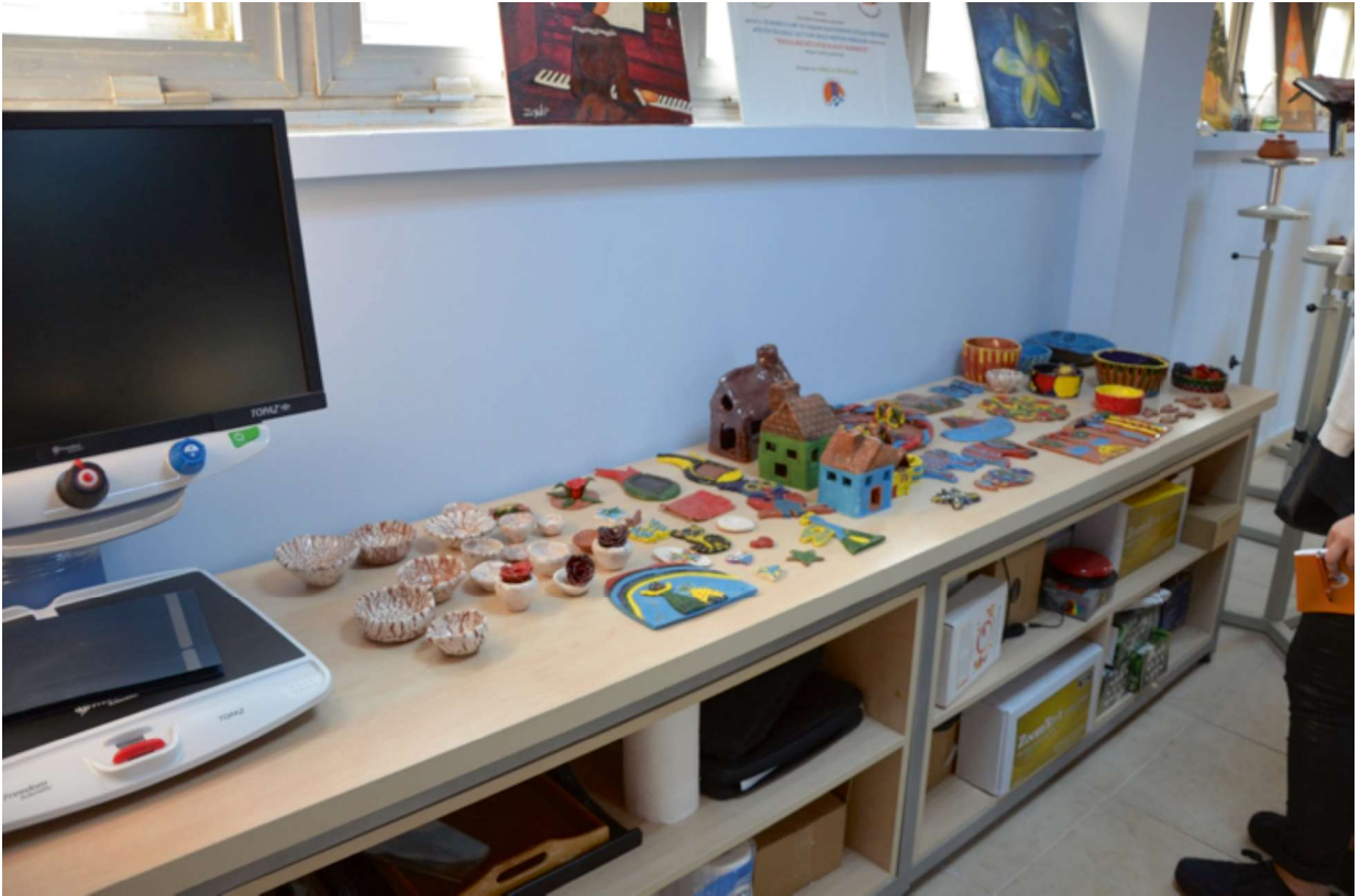
Resim 3. Resim ve Seramik Atölyesi

Sesli kitap okuma kayıt odasında oluşturulan uygun donanım ve yazılım ortamı ile gönüllü okuyucular aracılığı ile sesli kitaplar oluşturularak, engellilerin kullanımına sunulmuştur. Ayrıca, engelliler için kabartma kitap basımına uygun yazıcı ile kitap basımı yapılarak görme engellilerin okuyabileceği kitap sayısı artırılmıştır. Fotoğraf atölyesine alınan baskı makinesi ve engelliler için tasarlanmış ve farklı niteliklerdeki makineler aracılığı ile engellilere farkındalıklarını artıracak kültürel ve sanatsal hobiler kazandırılması sağlanmıştır.