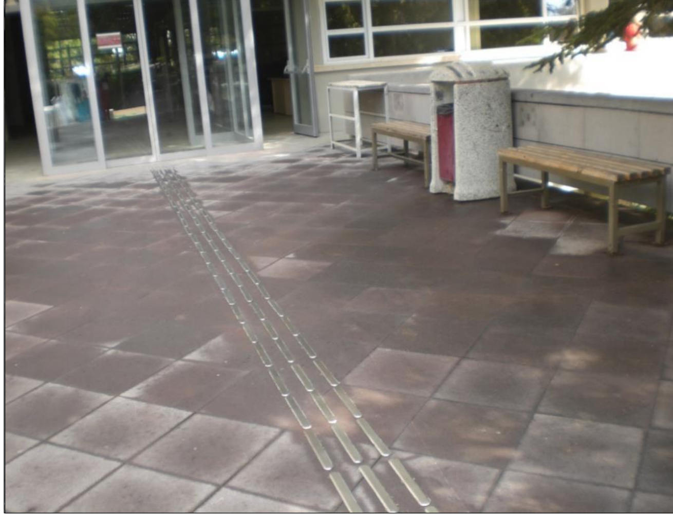
Hissedilebilir Yüzey Uygulamaları